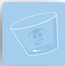
Face Verre vide